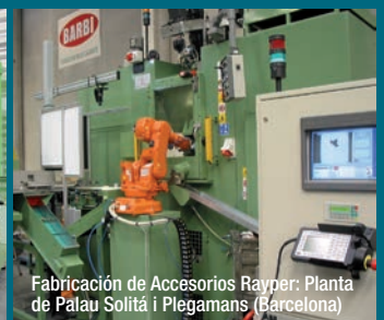
Fabricación de Accesorios Rayper: Planta de Palau Solità i Plegamans (Barcelona)