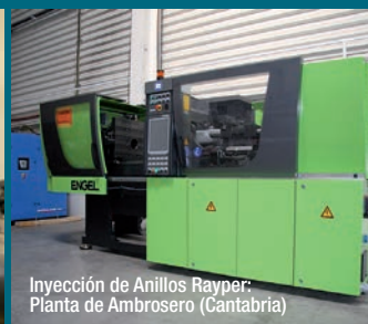
Inyección de Anillos Rayper: Planta de Ambrosero (Cantabria)