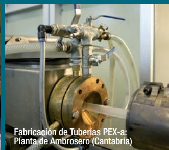
Fabricación de Tuberías PEX-a: Planta de Ambrosero (Cantabria)