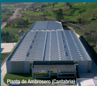
Planta de Ambrosero (Cantabria)